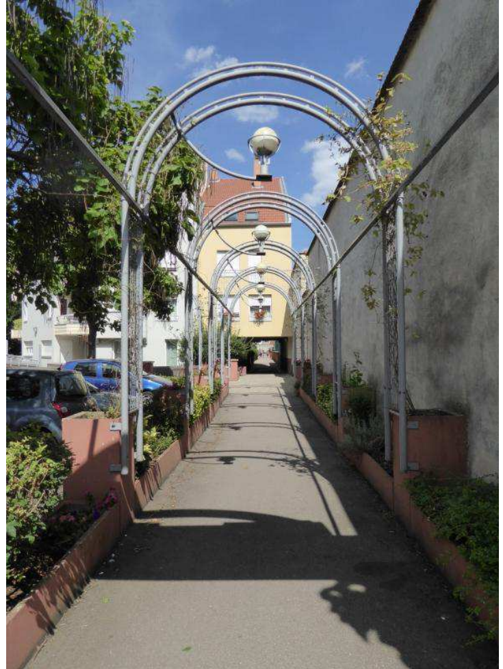
Depuis le boulevard, une pergola conduit les habitants vers les immeubles.