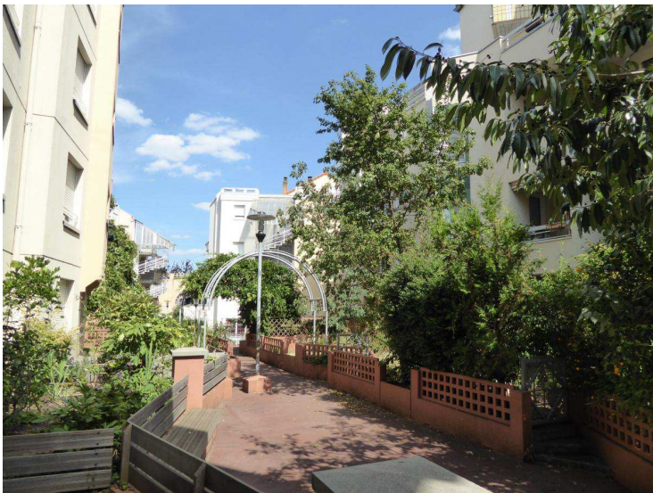
Les rues piétonnes desservent des jardins et des placettes.