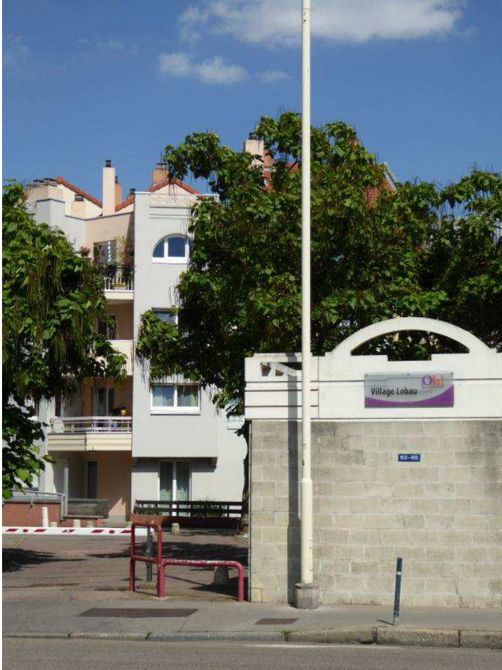
Par son mur de clôture, l'ensemble se préserve du désordre de la rue et crée son propre univers autonome.